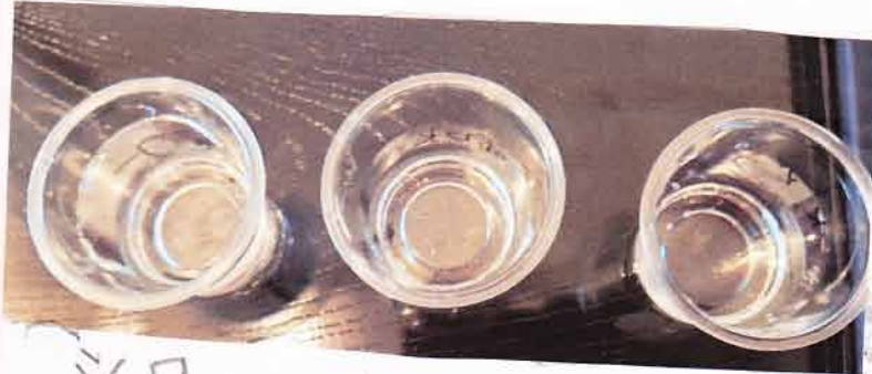
シャワー 雨水 水道水

• 雨水 かえるのにおいがした。 白い小さな虫みたいなものがいて いた。 シャワーと水道水はにおい みためがかからなかった。